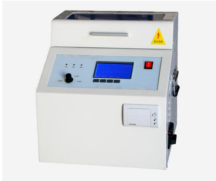
EDIJJ-II 全自动绝缘油介电强度测试仪