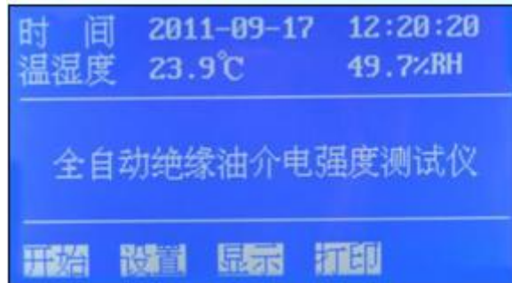
图 1 开机页面