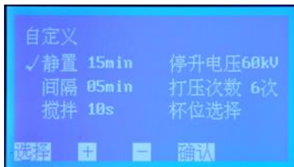
图 5 自定义设置子页面

6. 在图 2 页面下，按 选择 键移动光标 √ 至 自定义设置 处，按 确认 键即可进入 自定义设置 子页面（图 5）；