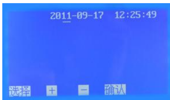
图 4 时间设置子页面

5. 在图 2 页面下，按 选择 键移动光标 √ 至 时间设置 处，按 确认 键即可进入 时间设置 子页面（图 4）。