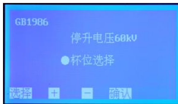
图 3 GB1986 子页面

在图 3 页面下，按 选择 键移动光标至 停升电压，按 + 或 - 键设置停升电压，其默认值是 80 kV，可选范围 10 kV~80 kV（增量 \Delta = 10 kV）。选择完毕后，按 确认 键返回开机页面，按 开始 键进行测试。